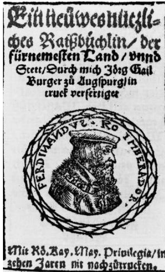
Abbildung 3: Deckblatt aus dem Raißbüchlin (Reisebüchlein, 1563 in Augsburg veröffentlichtes Routenhandbuch) (Anonym, 2024)

“Raißbüchlin“ begann auch die Produktion gedruckter sog. Itinerare mit exemplarischen Reiseverläufen an, die sich an die im Spätmittelalter bekannten Pilgerführer anlehnten.