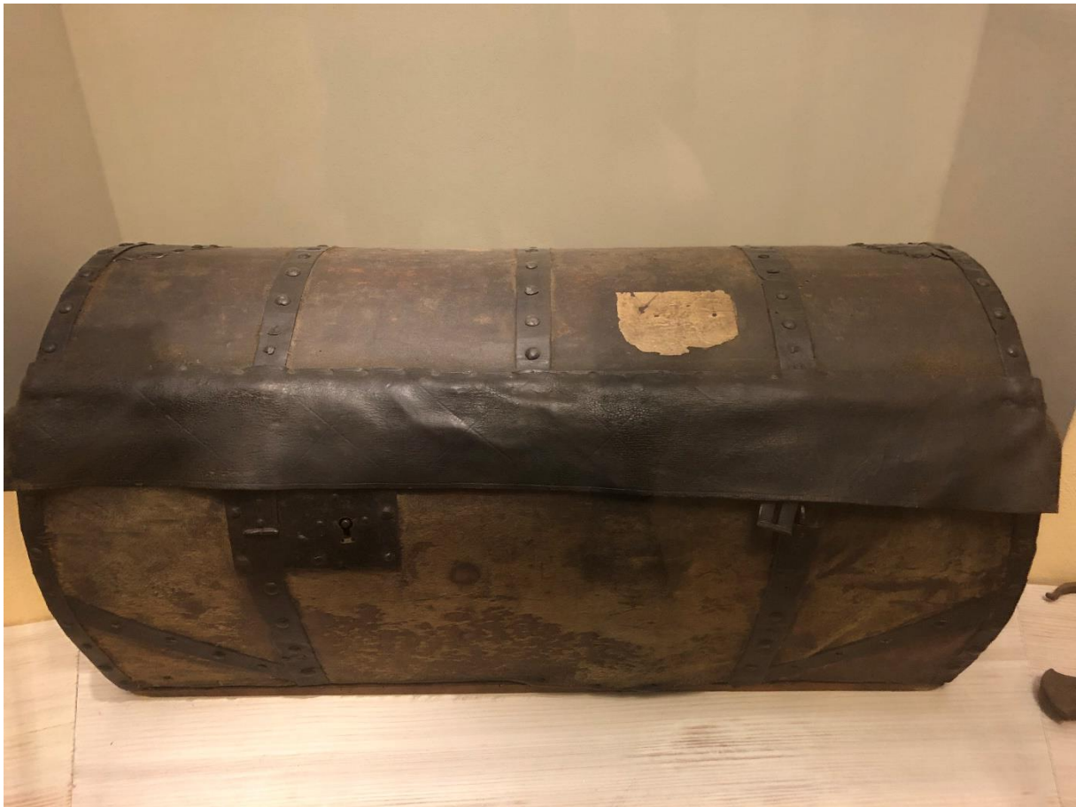
Abbildung 8: Regenfeste Reisetruhe um 1750. Sie konnten auf den Dächern der Kutschen transportiert werden (DHM, 2020)