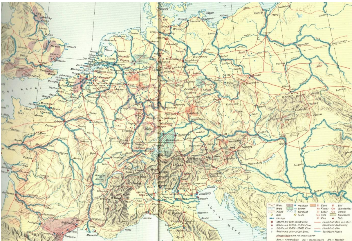
Abbildung 7: Wirtschaft und Wirtschaftsweg Mittel- und Westeuropas um 1500 (Ammann, 1965)

technische Kenntnisse noch Willen, die Straßen befahrbar zu halten. So waren diese Routen bei Regen häufig unbefahrbar. Dennoch mussten Reisenden an die Landesherren Geleit-, Wege- oder Brückengeld zahlen. Die Reisegeschwindigkeit betrug auf unbefestigten Landstraßen bei einer maximalen Achslast von drei Tonnen bis zu sieben Kilometer pro Stunde.