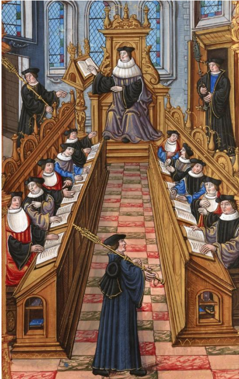
Abbildung 2: Zusammenkunft von Doktoren an der Universität von Paris (Anonym, 2018)

Der Studentenstatus schien offenbar so attraktiv zu sein, dass das „studentische Angebot“ auch von solchen Personen wahrgenommen wurde, die nicht studieren wollten, sondern nur den vorübergehenden Rechtsstatus eines Studenten nutzen wollten. Vielleicht war es auch eine der wenigen Möglichkeiten, sich als Fremder in einer Stadt aufzuhalten. Maisel (2015) zählt für den Zeitraum des 15. Jahrhunderts über dreißigtausend Namen in den Matrikeln der Universität Wien. Die Mehrzahl der Immatrikulierten erreichten keinen formalen Abschluss, z.B. als Bakkalaureat an der facultas artium / Artistenfakultät. Es wird berichtet, dass sich auch Personen in die Matrikel eintrugen, die nur vordergründig studierten und sich als Kaufleute oder schlicht Reisende in der Stadt aufhielten. (Maisel, 2015) Dies war möglich, weil das Einschreiben nicht an Ausweisdokumente oder bereits absolvierte Semester und Vorkenntnisse gebunden war. Bis zum Erreichen des Bakkalaureats konnte ein Studium sechs Jahre dauern. Bis zu zwölf Jahre waren für die Erreichung eines Magister- oder Doktorabschlusses notwendig. Allein schon die materiellen Anforderungen waren eine große Hürde, dieses